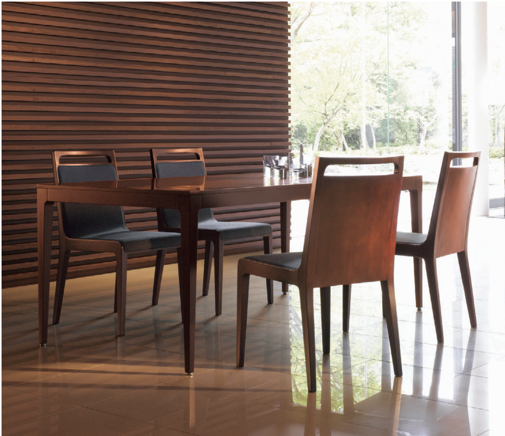
▲ミールス 1N ¥49,500 張材:布地・C-53 (ダークグレー) テーブル:参考品