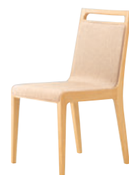
5N 布地・D-54 (アイボリー)