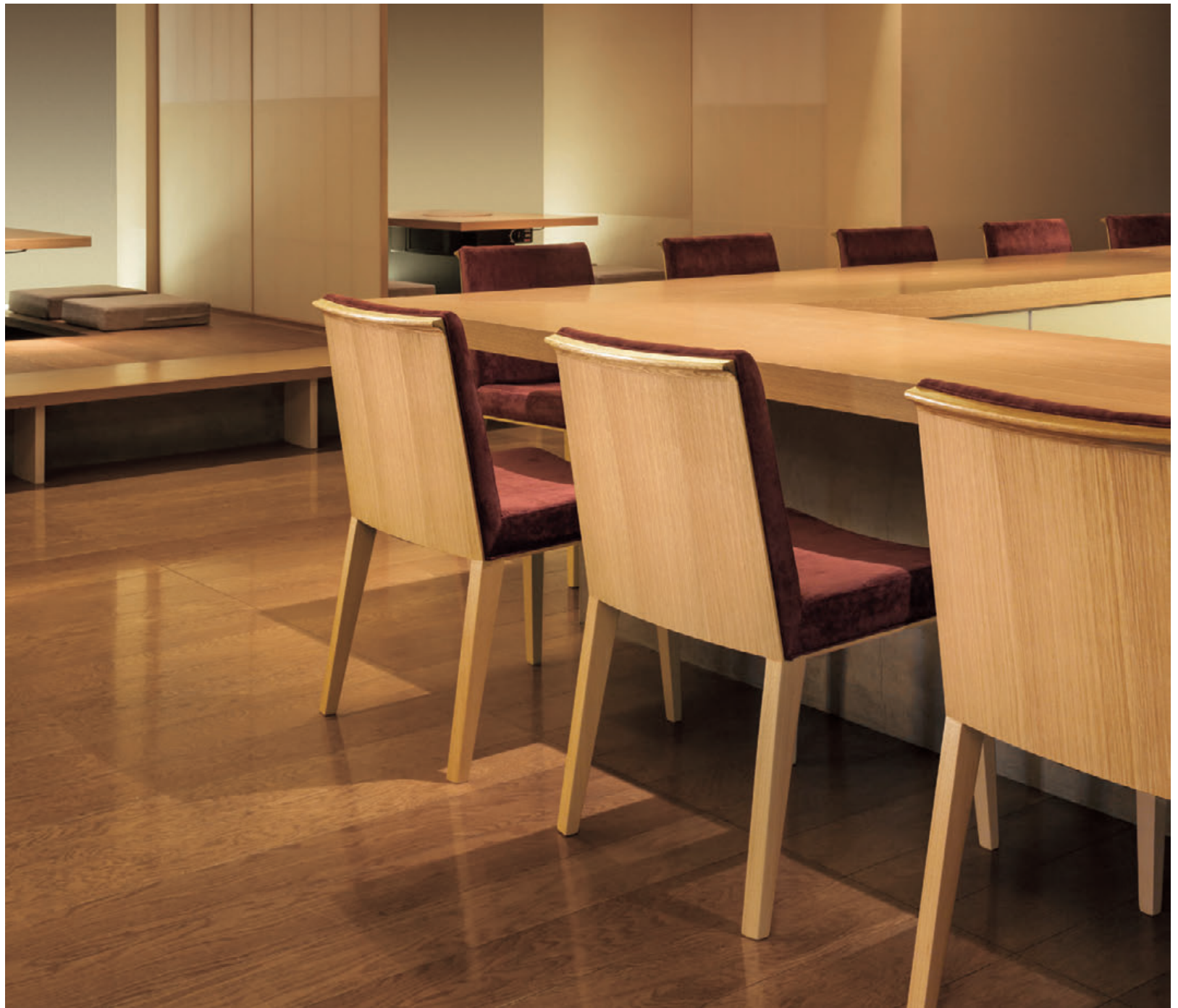
▲セレン 5N ¥65,300 張材:布地・C-52 (ブラウン)