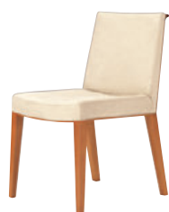
9N 布地・C-52 (アイボリー)