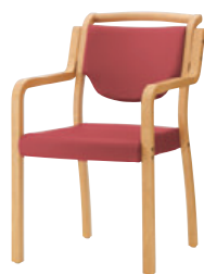
5NL レザー・C-12 (No.13)

フレーム:ラバーウッド成型合板 座:モールドウレタンフォーム スタッキング可能(床積6脚) 重量:8.0kg