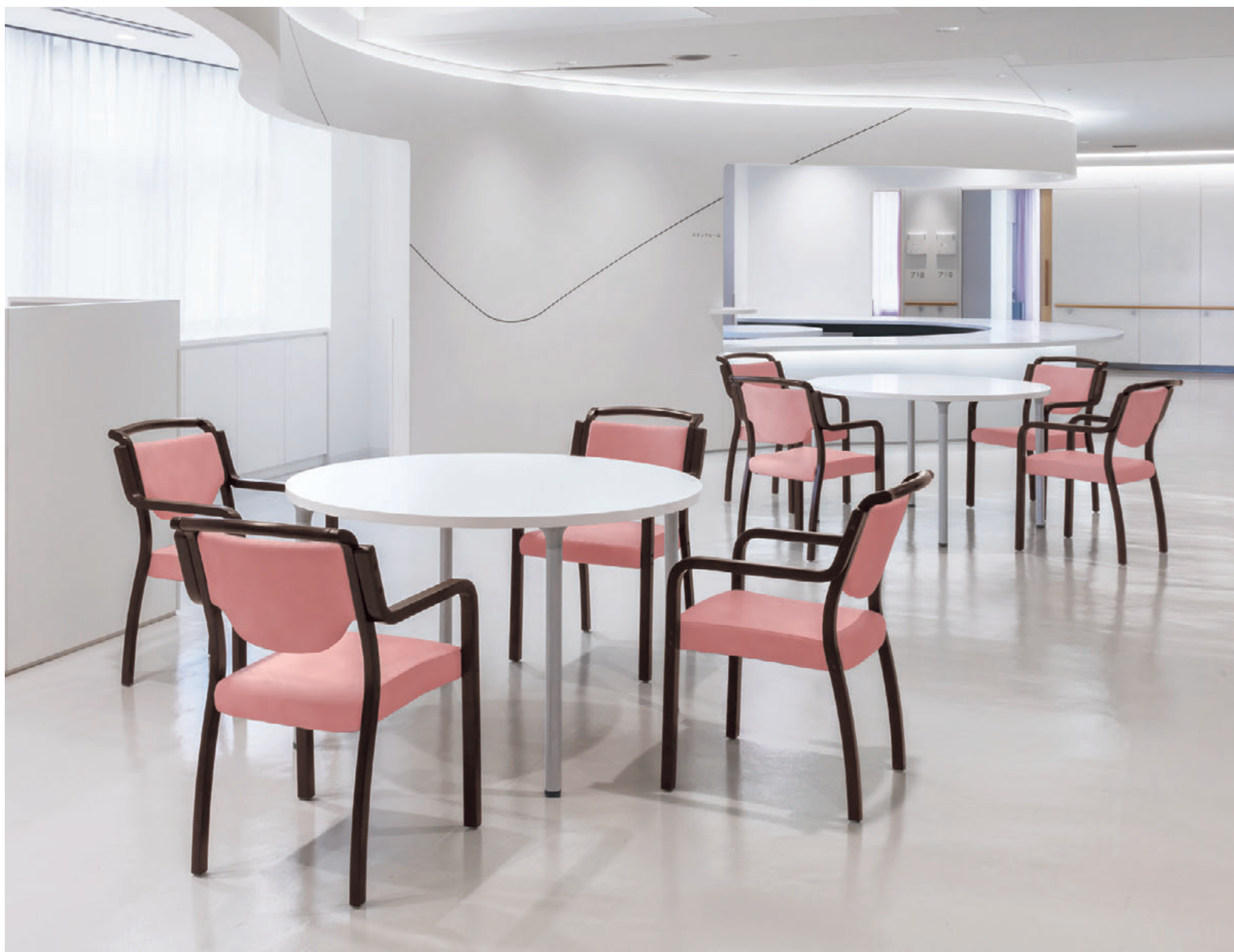
▲ロワ 1N ¥57,300 張材:レザー・C-38 (No.3) テーブル:T18 MW-1200φ - MD-SI (P315)