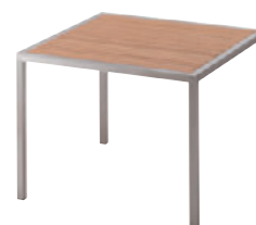
TB2481 - YA ¥112,600

天板: ポリスチレン 脚: ステンレスパイプ (研磨仕上げ)・アジャスター付 ※TB2481-YAは屋外でもご使用いただけます。