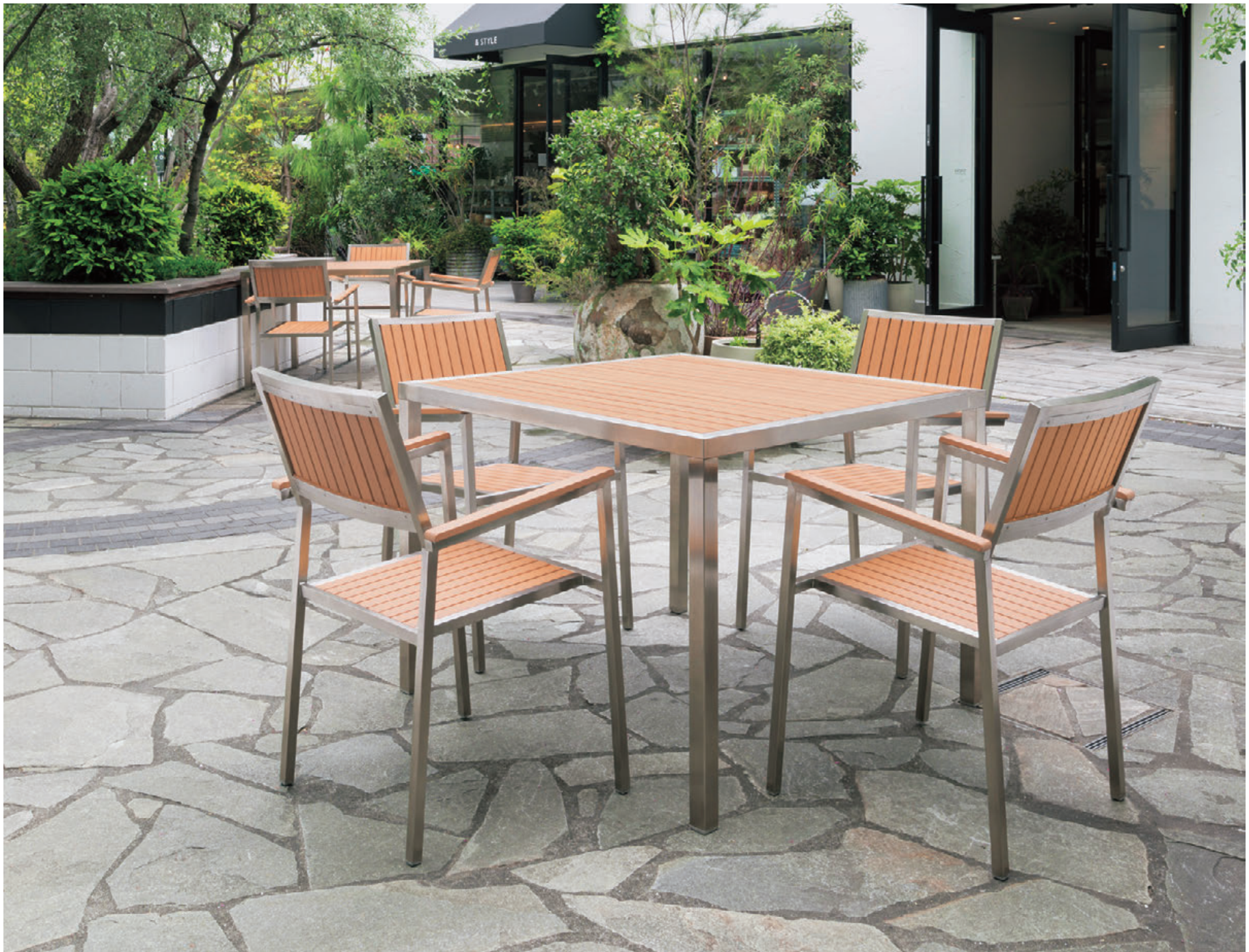
▲ラウト ¥49,800 TB2481-YA ¥112,600