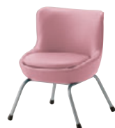
SI レザー・A-80 (No.76)