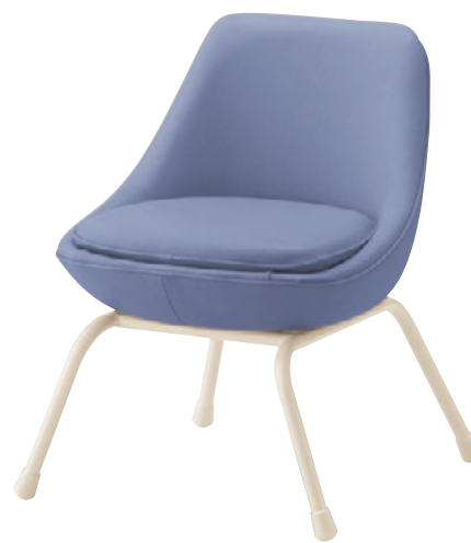
ユッタ WH ¥37,100 張材: レザー・A-80 (No.87)