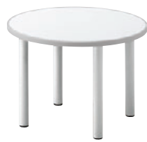
TB2995 - LK-SI