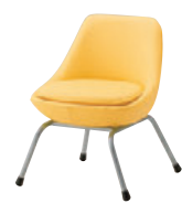
SI レザー・A-80 (No.40)