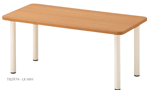
TB2974 - LK-WH