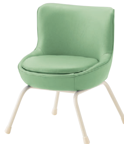
マージー WH ¥39,900 張材: レザー・A-80 (No.84)