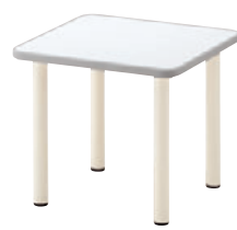
TB2992 - LK-WH