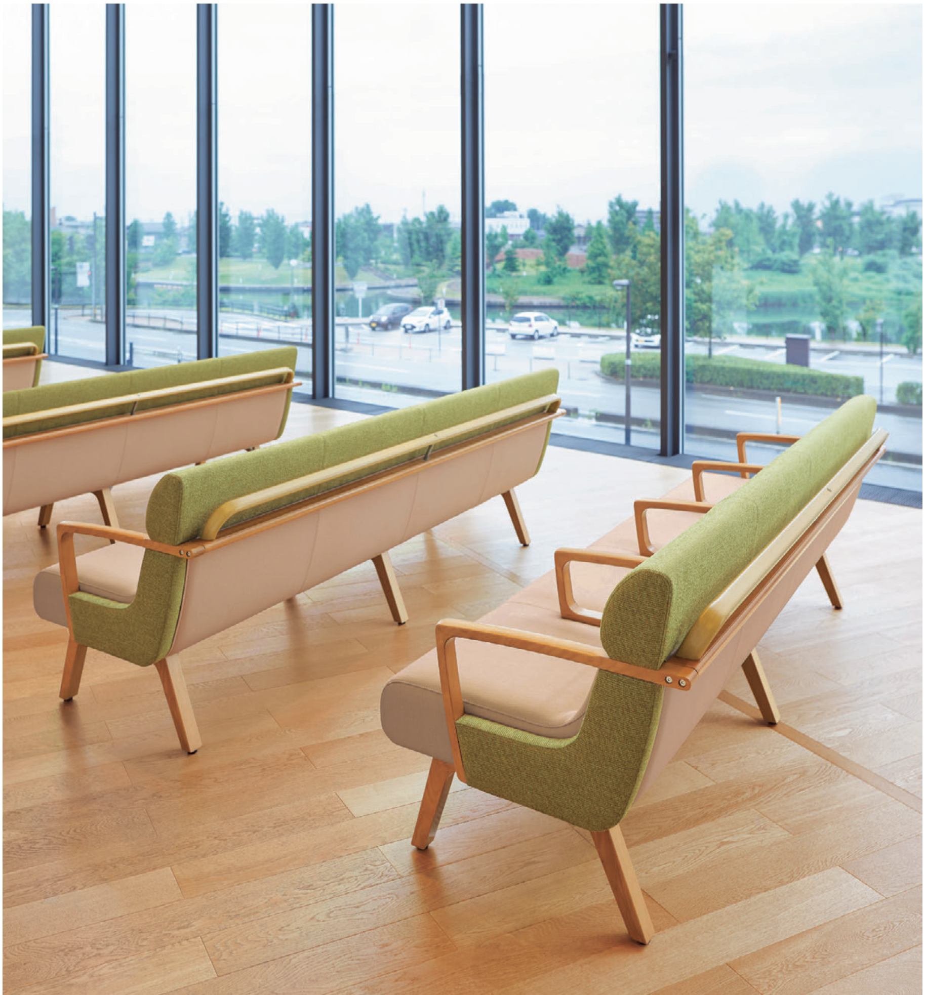
▲コルナスLYH 5N-A(手すり付) ¥455,300 張材:布地・C-41(ライトグリーン)×レザー・C-12(No.3)