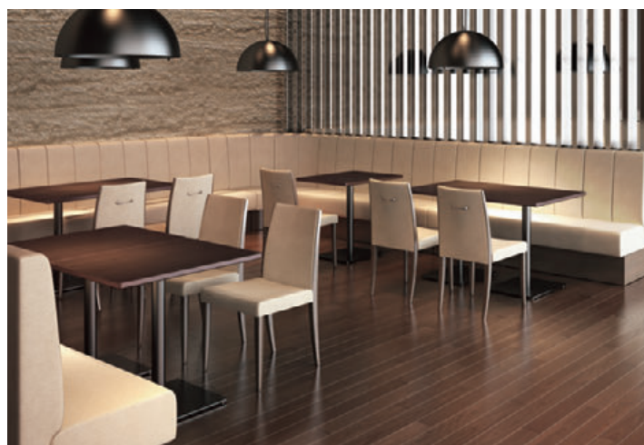
(写真左) バンA1 OM-4 (W1300 H750) -NA 張材:レザー・B-15 (No.9, 26) テーブル: T14 MN-600W 750D - SS-SI (P318) T14 MN-600φ - SS-SI (P318) チェア:ラゲットA1 WH (P163)