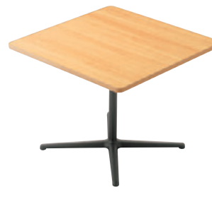
T25 MN-900W 900D - GF-BL ¥72,100 700H/脚900L 天板:¥44,400 脚部:¥27,700