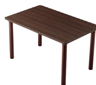
T25 MD-1200W 750D - MB-1N ¥91,200 700H 天板:¥55,200 脚部:¥36,000