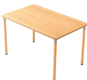
T25 MN-1200W 750D - MD-NA ¥80,700 720H 天板:¥55,200 脚部:¥25,500