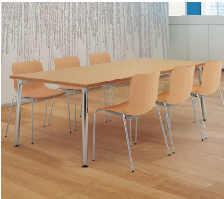
▲TB2818 - YN-CR ¥154,600 2100W 1100D 720H チェア:モトルAA (P165)