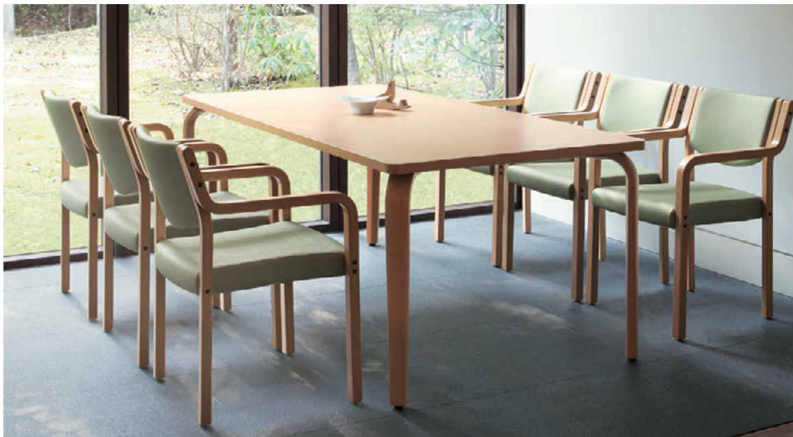
▲T20 M2-1800W 900D - ML 5N ¥107,100 700H ○反り止め金具付 チェア:リスカB 5NL (P136)