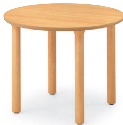
T25 MN-900φ - MB 8N ¥76,200 700H 脚部:¥36,000 天板:¥40,200 >> P317 表面材・メラミン化粧板 縁材・塩ビソフトエッジ