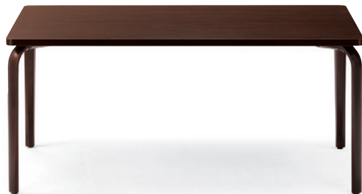
T20 M9-1600W 900D - ML 1N ¥102,100 700H 脚部:¥42,000 天板:¥54,500 >> P313 表面材・メラミン化粧板 縁材・ABS樹脂 ○反り止め金具付