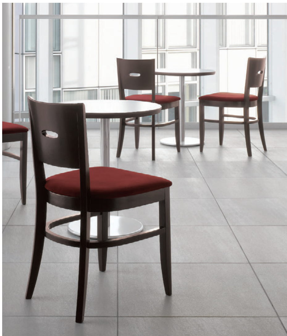
▲レーテ ¥30,000 張材:布地・C-52 (ブラウン) テーブル:T22 1N-600φ -SL-CR (P320)