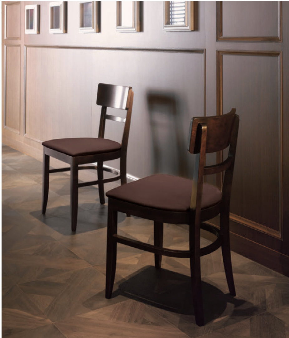
▲プレミス ¥29,900 張材:布地・C-52 (ダークブラウン)