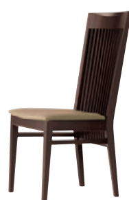
1N レザー・B-26 (No.1)