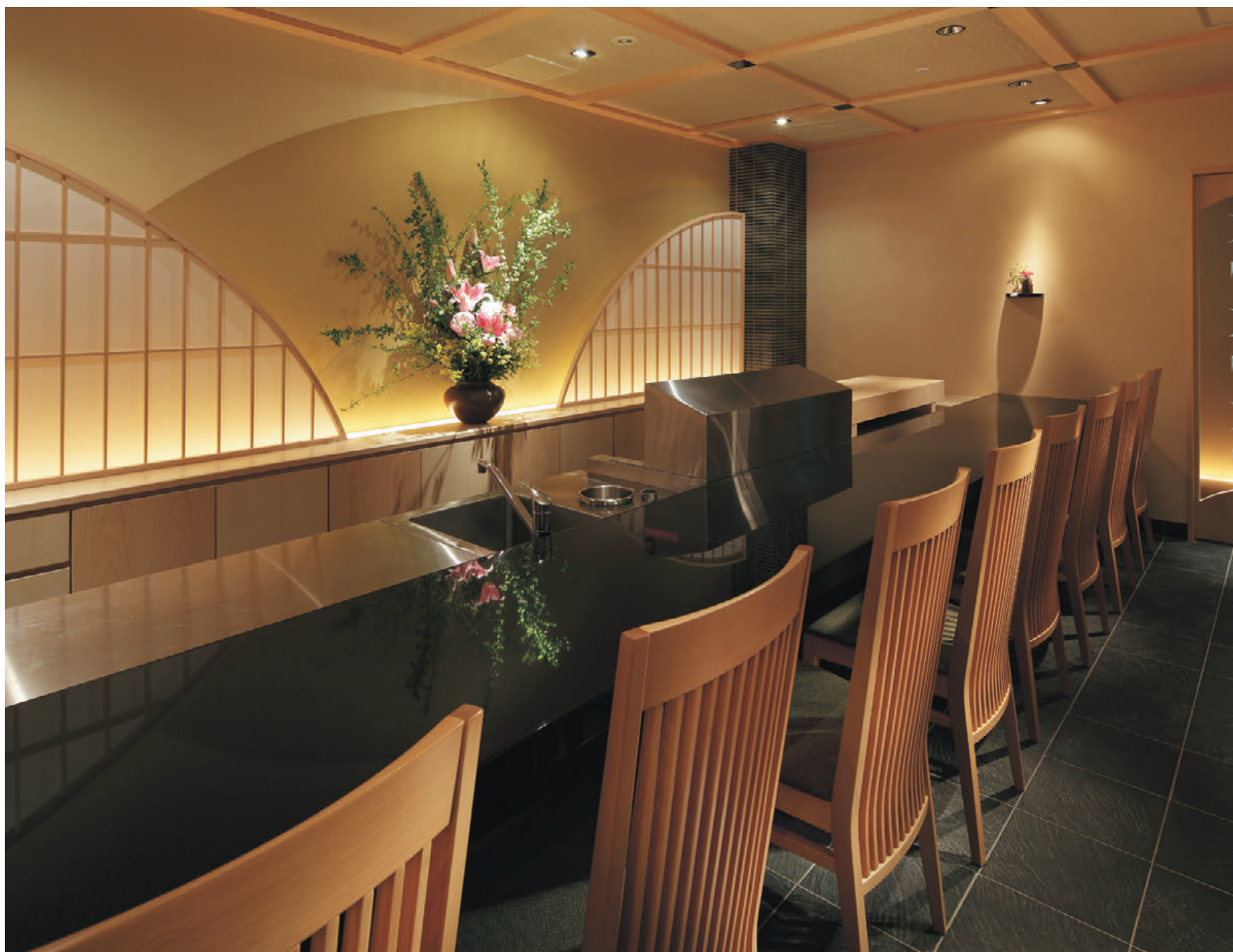
▲サルミ 5N 張材:布地