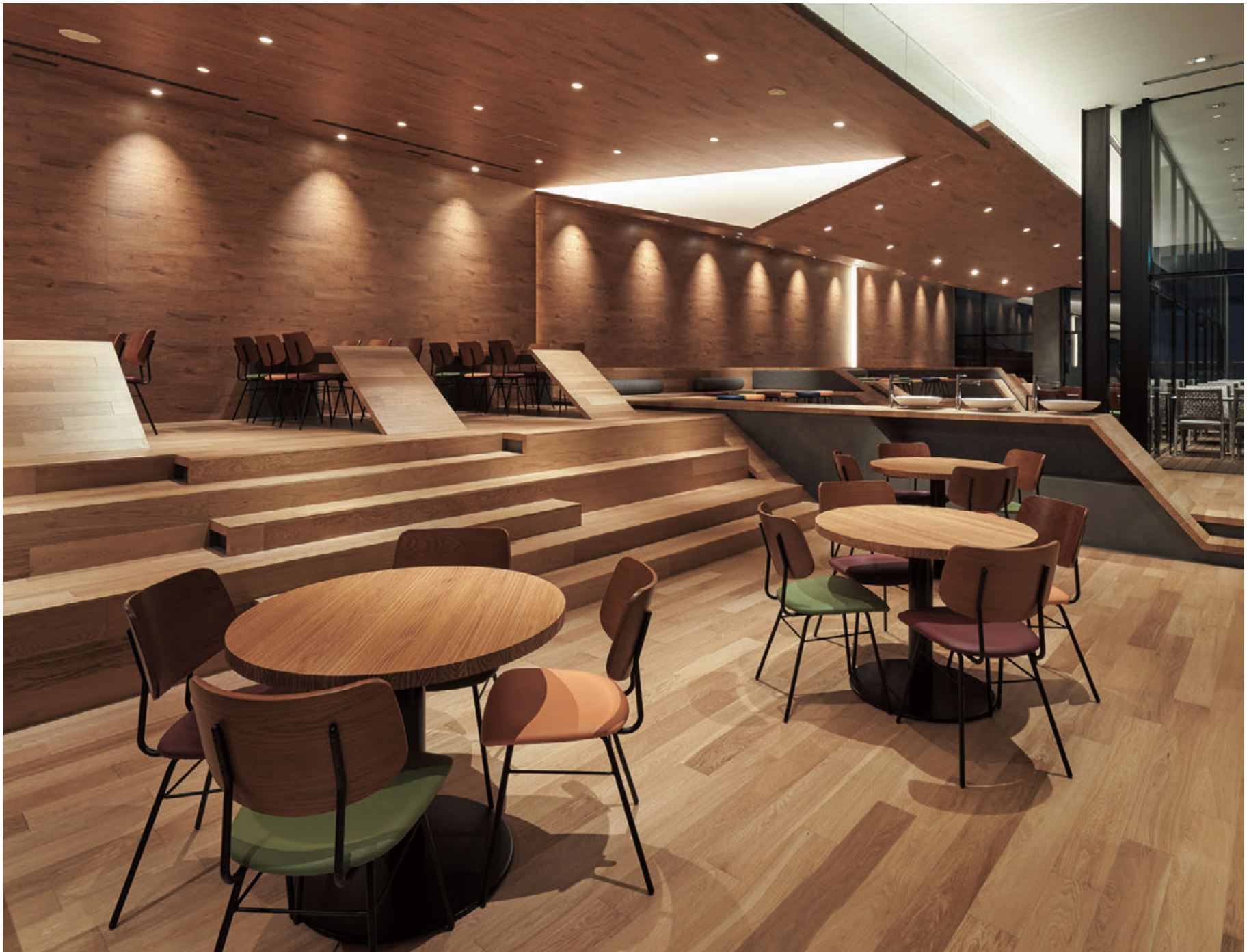
▲ミロス2BR 張材:レザー