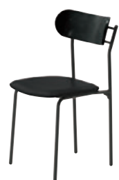
DG-6T レザー・B-25 (No.10)