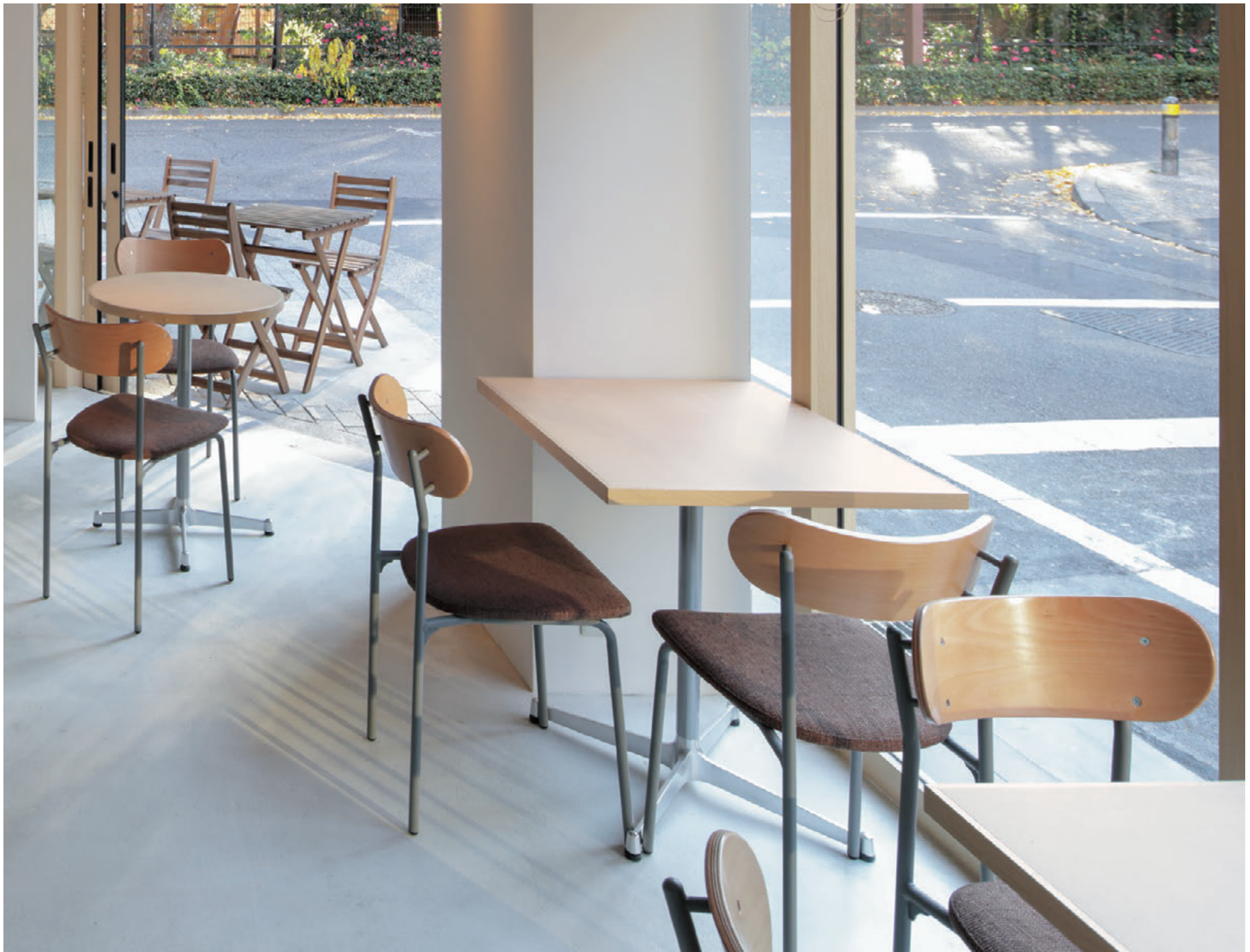
▲コトルSI-5N ¥39,800 張材:布地・D-54 (ブラウン)