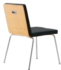
CR-5N レザー・C-22 (No.6)