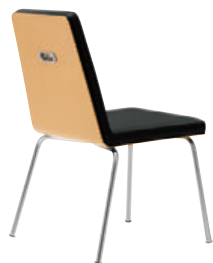
CR-5N レザー・C-22 (No.6)