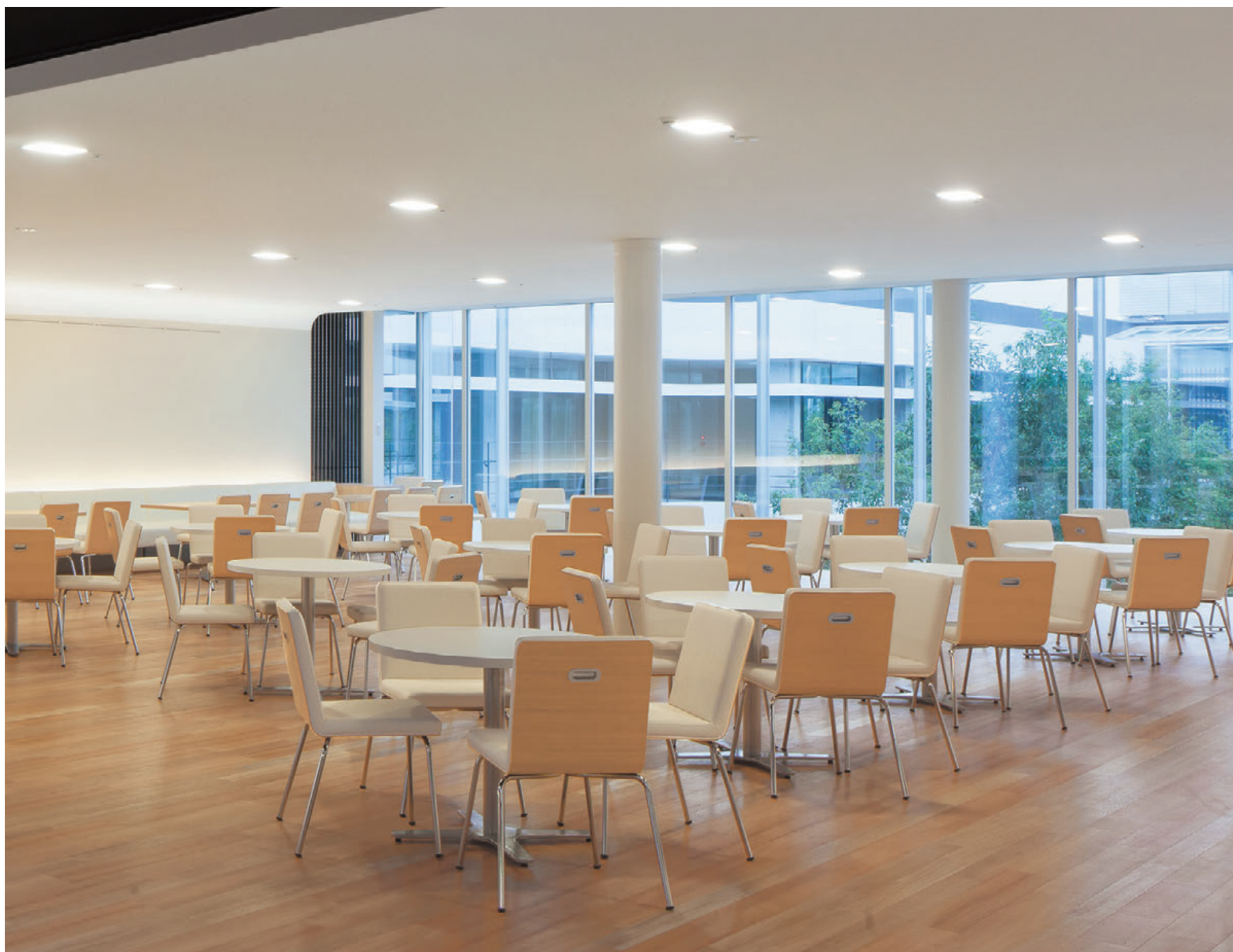
▲テレスL CR-5N 張材:レザー