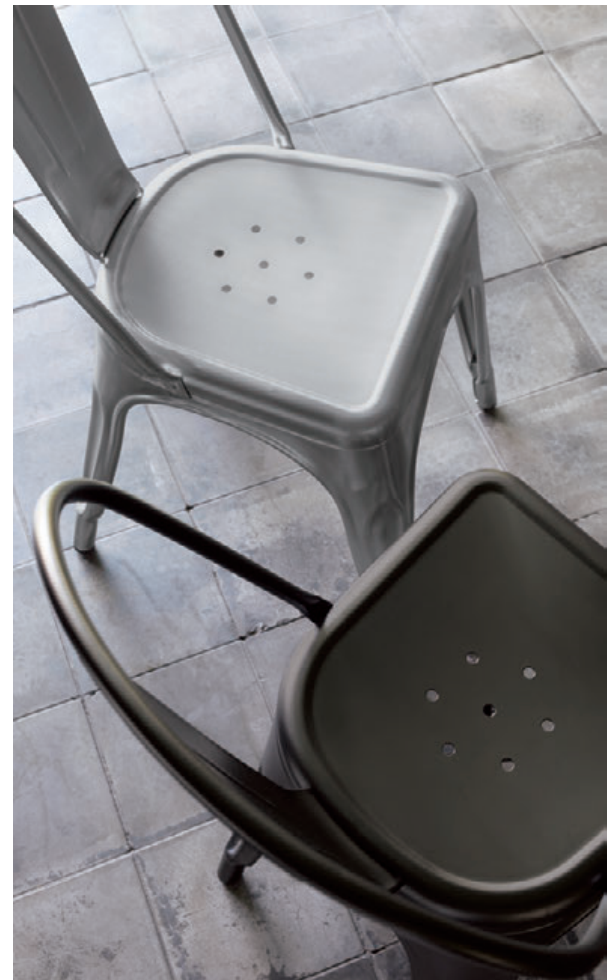
▲マタンBL ¥40,500 マタンSI ¥40,500 テーブル:TB3129-LE-DG (P328)