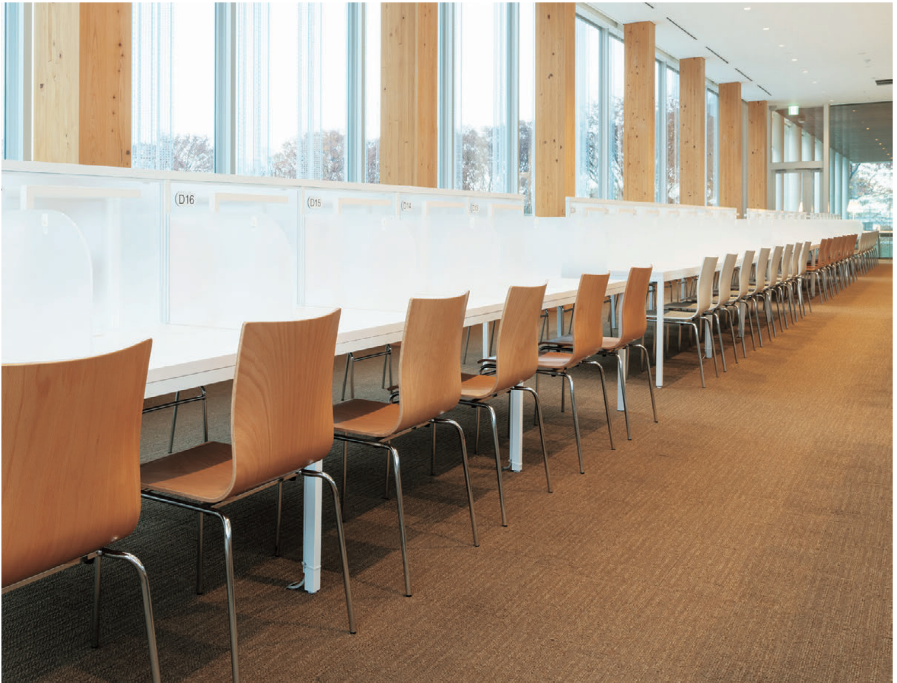
▲フィクスA1 CR-5N フィクスA1 CR-WH ¥28,900