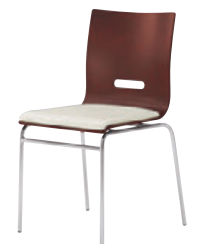
B2 CR-2N レザー・B-15 (No.35)