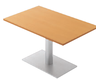
T18 5N-1200W 750D - EV1-SI ¥69,100 700H/脚750×450 天板:¥35,400 脚部:¥33,700 >> P372