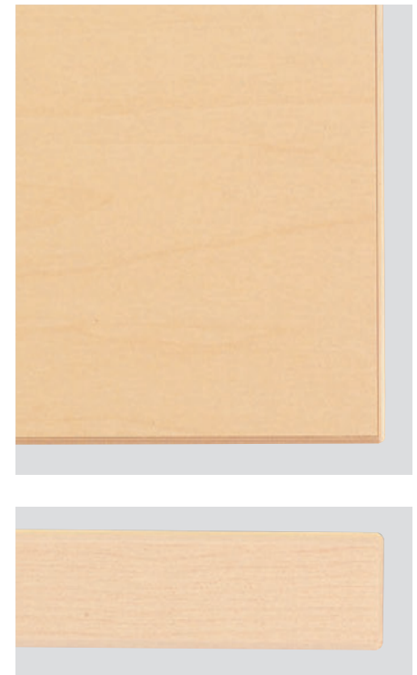
▲T18 MN-600W 750D - GV-SI ¥49,400 700H/脚640L チェア:クラルス1DB (P111)