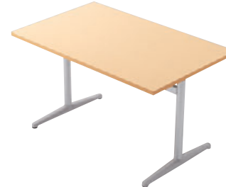
T18 MN-1200W 750D - IF-SI ¥67,100 700H/脚650L 天板:¥35,400 脚部:¥31,700 >> P378