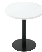
T18 MW-600φ - QV-MB ¥50,700 650H/脚400φ 天板:¥20,800 脚部:¥29,900 >> P373