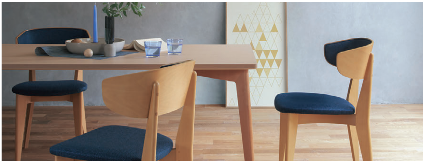
▲T14 MN - 1800W 900D - LG-5N ¥180,500 696H ○反り止めパーツ付 チェア:モルヘンB 5N (P20)