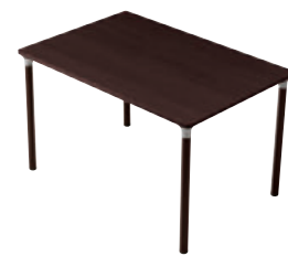
T14 MD-1200W 800D - MD-DB ¥73,500 716H 天板:¥48,000 脚部:¥25,500 ≧ P384