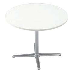
T14 MW-900φ - GF-PO ¥64,100 696H/脚750L 天板:¥42,400 脚部:¥21,700 ≧ P375