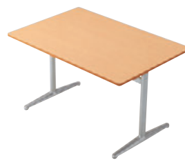
T14 MN-1200W 800D - IF-PO ¥79,700 696H/脚650L 天板:¥48,000 脚部:¥31,700 ≧ P378