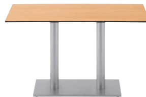
T13 MN-1200W 750D - EV2-SI ¥96,300 700H/脚750×450 天板:¥57,200 脚部:¥39,100 >> P372

※1200W 750D にEVシリーズの脚を合わせる場合は、EV2をご使用ください。