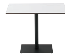
T13 MW-900W 600D - SF-BM ¥58,800 650H/脚520×400 天板:¥33,300 脚部:¥25,500 >> P371

YD / YK 脚 ワイドオーダー価格 600W~1800Wまで50mm単位でオーダーできます。