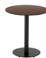
T13 MD-600φ - QV-MB ¥54,100 650H/脚400φ 天板:¥24,200 脚部:¥29,900 >> P373

※1200W 750D にEVシリーズの脚を合わせる場合は、EV2をご使用ください。