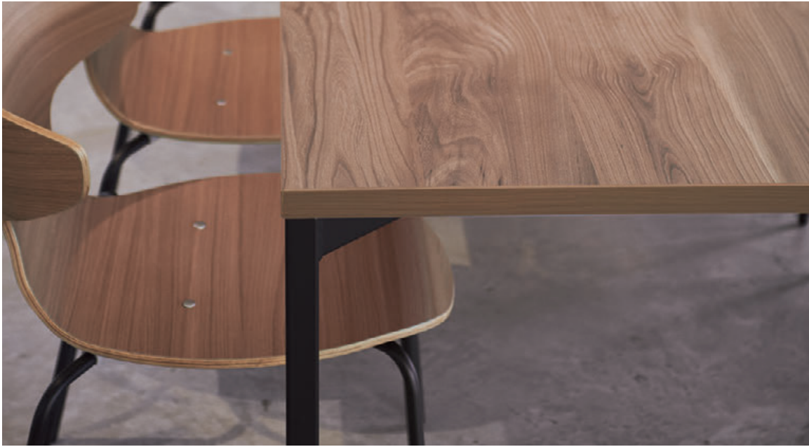
▲FT2-C03-1800W 900D - LE-DG ¥131,700 720H ○反り止めパーツ付 チェア:テモラA1 DG-MD (P162)