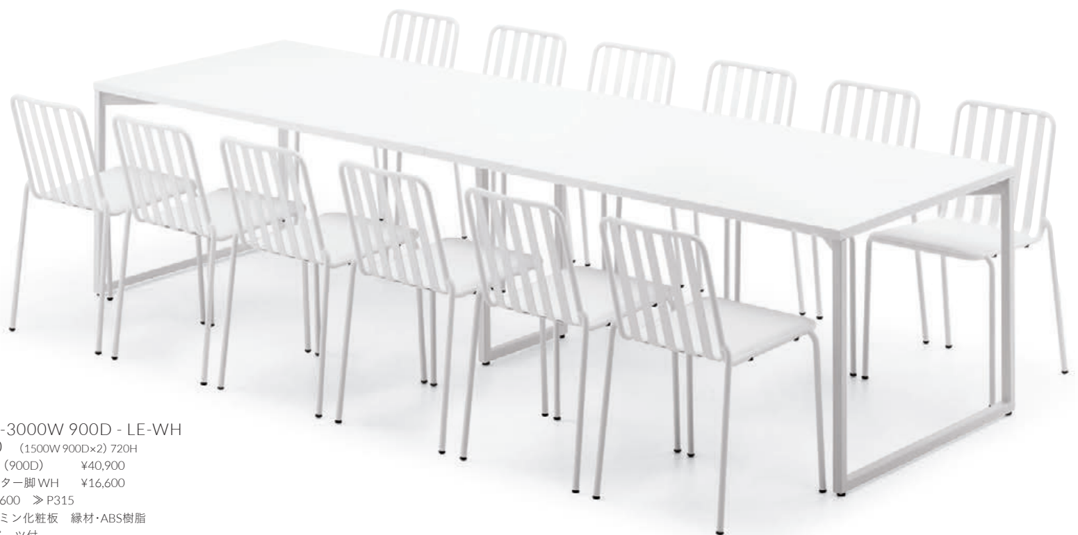
T18 MW-3000W 900D - LE-WH ¥179,300 (1500W 900D×2) 720H 脚部:LE-WH (900D) ¥40,900 LEセンター脚 WH ¥16,600 天板:¥104,600 > P315 表面材・メラミン化粧板 縁材・ABS樹脂 ○反り止めパーツ付 チェア:ポワロ2WH (P156)