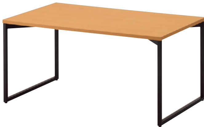
T18 5N-1500W 900D - LE-DG ¥101,800 720H 脚部:¥40,900 天板:¥52,300 > P315 表面材・メラミン化粧板 縁材・ABS樹脂 ○反り止めパーツ付